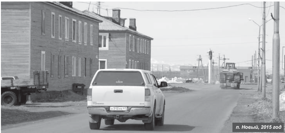
п. Новый, 2015 год

С июля 2016 года полномочия по содержанию и текущему ремонту жилых домов в п. Новом районного центра исполняет ООО «Коммунэнерго УКМР».