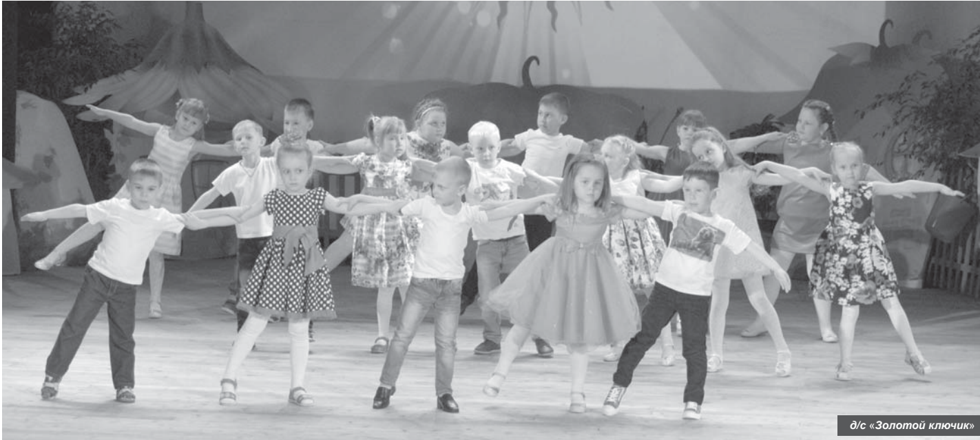
д/с «Золотой ключик»

3 июня в Усть-Камчатске состоялся гала-концерт районных фестивалей детского дошкольного творчества «Маленькая страна» и хореографического искусства «Полёт вдохновения».