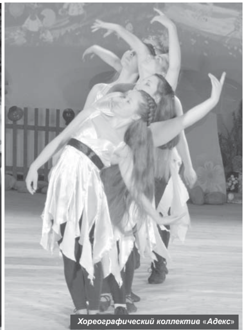
Хореографический коллектив «Адекс»